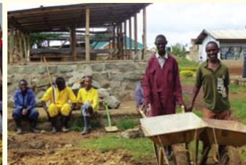
Landwirtschaft & Gartenbau der MMSW