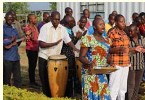
Schülerinnen und Schüler der MMSS