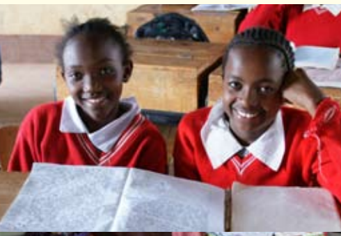
Kinder der St. Michael Academy im Klassenzimmer

Auf einem Grundstück im Ortsteil Gatuanyaga entstehen Werkstätten und Wohnmöglichkeiten für erwachsene Menschen mit Behinderung: die Maria Magdalena Sheltered Workshops (MMSW). Dieses Pilotprojekt ist in Kenia einmalig.